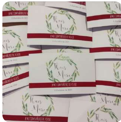
Pulsera blanca o grante #micompañerodeviaje

Personaliza las tarjetas con las que te entregaremos las pulseras y contribuye de una forma muy especial y personal a la lucha contra el cáncer infantil.