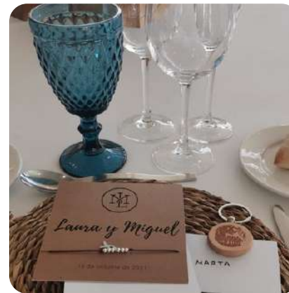
Pulsera hilo colores cáncer #micompañerodeviaje